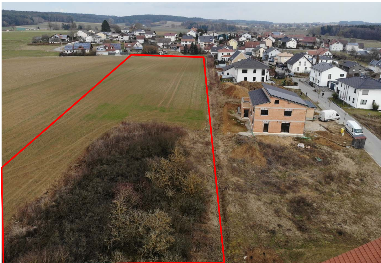
Abbildung 2 Bestand, Blickrichtung von Westen nach Osten

Das unten stehende Drohnenbild vom 10.03.2021 zeigt die bestehende Nutzung und umgebende Bebauung. Der ungefähre Umgriff zur Bauleitplanung ist in Rot dargestellt. Die Beseitigung der Gehölzstrukturen ist unabhängig vom Bauleitplanverfahren bereits genehmigt.