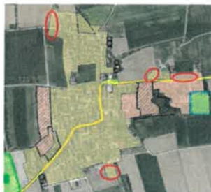
Abbildung 4: Auszug aus dem Rauminformationssystem für den Ortsteil Großmuß