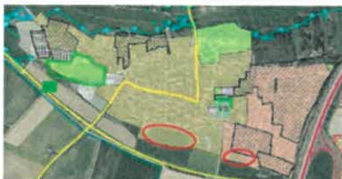
Abbildung 2: Auszug aus dem Rauminformationssystem für den Hauptort Häusen