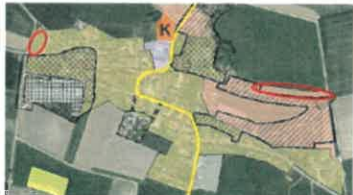
Abbildung 3: Auszug aus dem Rauminformationssystem für den Ortsteil Herrwahlthann