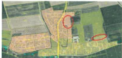
Abbildung 1. Auszug aus dem Rauminformationssystem für den Ortsteil Salzdorf

letztendlich aber niemand bereit war, sein Grundstück zu verkaufen bzw. zu bebauen. Mit einer Erkundung der Verkaufsbereitschaft von Grundstückseigentümern hat die Gemeinde einen wichtigen Grundstein zur Aktivierung von Innenentwicklungspotenzialen gelegt. Aus diesem Grund kann LEP 3.2 Z als gerade noch erfüllt angesehen werden. Nach Aufzeigen des Ergebnisses stellt die Befragung allerdings zukünftig keine ausreichende Strategie zur Aktivierung von Flächenpotenzialen dar. Aus hiesiger Sicht macht es keinen Sinn, größere Flächenpotenziale weiter als „Bauerwartungsland“ vorzuhalten, wenn die Eigentümer keine entsprechende Abgabebereitschaft erkennen lassen, oder die Areale für eine andere Flächenutzung benötigt werden. Es ist kein Ausdruck einer nachhaltigen kommunalen Bodenpolitik, solche Flächen über Jahrzehnte im Flächennutzungsplan zu belassen, wenn keine Realisierungschancen vorhanden sind. Um eine Realisierung von künftigen Bauvorhaben außerhalb im FNP dargestellter Flächen zu ermöglichen, sind deshalb im Gegenzug andere Flächenpotenziale aus ebensolchem zurückzunehmen. Insbesondere sollten hierfür die nachfolgend aufgeführten Flächen in Betracht gezogen werden: Abbildung 1: